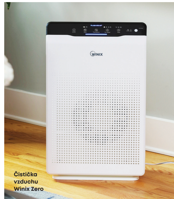
Čistička vzduchu Winix Zero

Cena a životnost příslušenství: Do většiny čističek je potřeba občas koupit nový filtr. Zjistěte si, kolik stojí a jak dlouho vydrží ve vašich podmínkách.