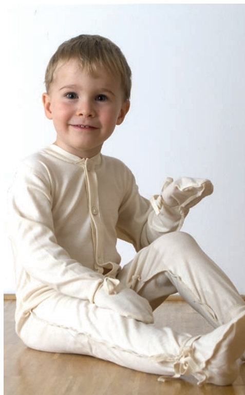
DermaProtec – pyžamová sada pro ekzematiky

Nadměrně citlivá kůže je velmi křehká, reaktivní, často podrážděná a nesnášenlivá. Osoby s tímto typem pokožky citlivě reagují na řadu vlivů vnitřních (infekční choroby, hormonální výkyvy, stres apod.) či vnějších (výkyvy počasí, oblečení, chemické látky, léky apod.). Pro ošetřování a hygienu tohoto typu pleti volíme specifické produkty, které kůži klidí a nevyvolávají dráždivé reakce.